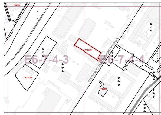
Границы территориальных зон, подзон территориальных зон и предельные параметры разрешенного строительства, реконструкции объектов капитального строительства